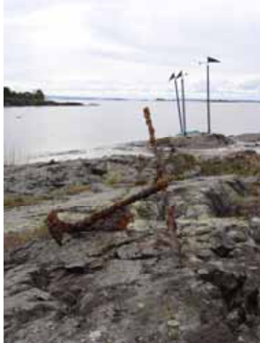
Lurö maj 2009