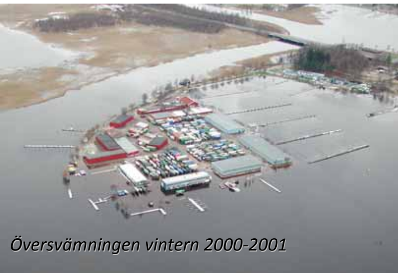
Översvämningen vintern 2000-2001

2001 dog 780 gråtrutar – i år hittills tio